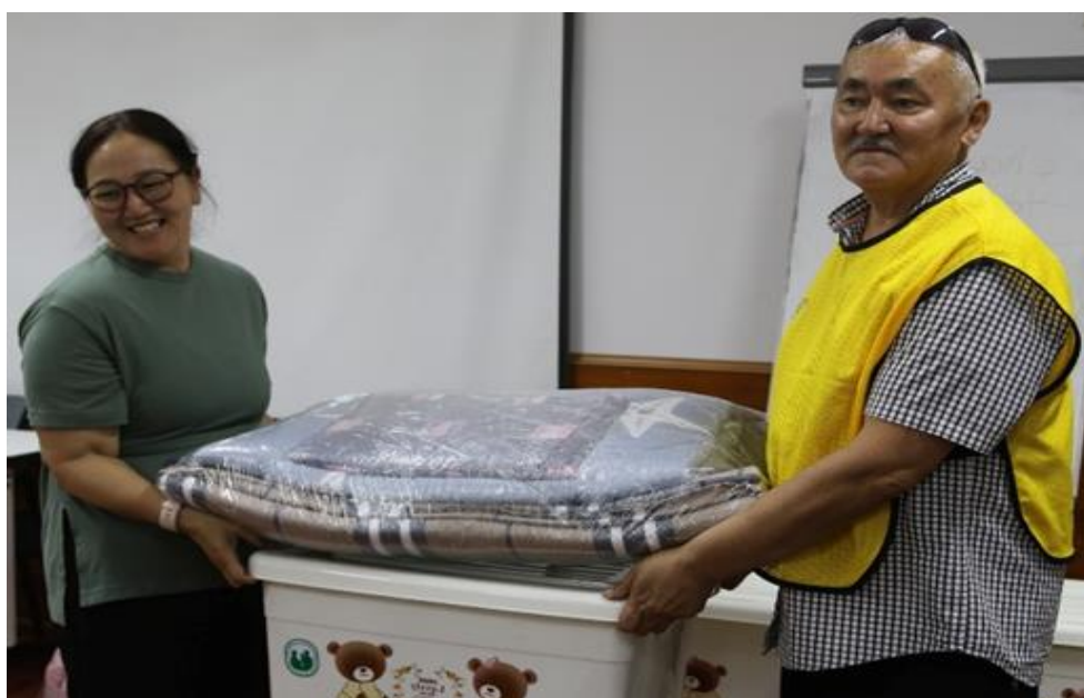
Үерт автсан иргэдэд тусламжийн багц хандивлалаа.

Хөгжлийн бэрхшээлтэй хүүхдүүдийн сурч, хөгжих, эмчилгээ сувилгаагаа чанартай хийлгэх орчин нөхцөлийг сайжруулах хүрээнд Зулзагын гол хүүхдийн зусланд гал тогооны тоног төхөөрөмжийн дэмжлэг тусалцааг үзүүлж байна.