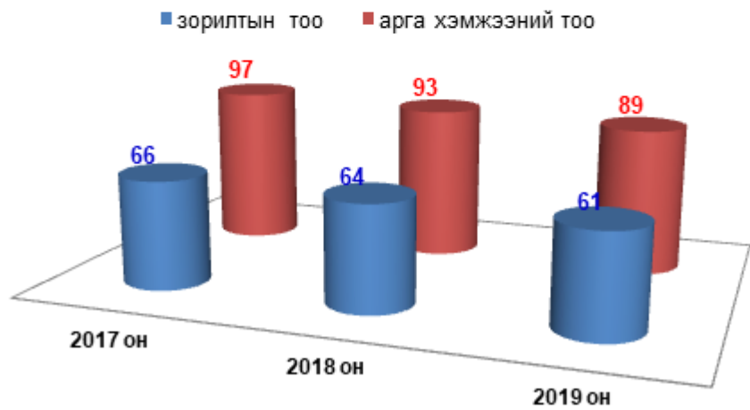
Хяналтад авсан зорилт, арга хэмжээний тоо